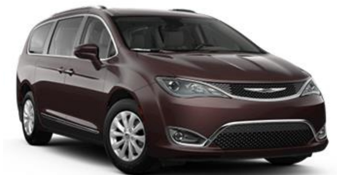
CHRYSLER PACIFICA 7 PAX

Specifik mærke / model og / eller tilgængelighed kan variere fra sted til sted. Viste biler repræsenterer producentens basismodel.