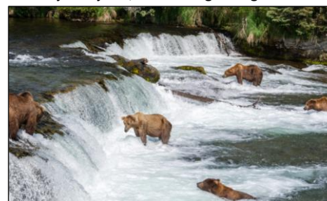
Katmai National Park

Rundreisen slutter i samme sted som den starter, nemlig i Anchorage. Om I vil køre direkte til lufthavnen eller blive lidt i området inden hjemrejsen, er efter eget valg